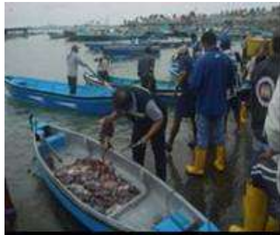
Figura 1. Registro de datos pesqueros

El desembarque de calamar gigante en el puerto de Santa Rosa (Figura 1) fluctuó entre 0.2 y 0.5 t, disminuyendo un 96% en relación al mes anterior, originado posiblemente a una distribución oceánica de las áreas de pesca, asociada a la presencia de aguas tropicales de 23.1°, reportadas por Earth (2019).