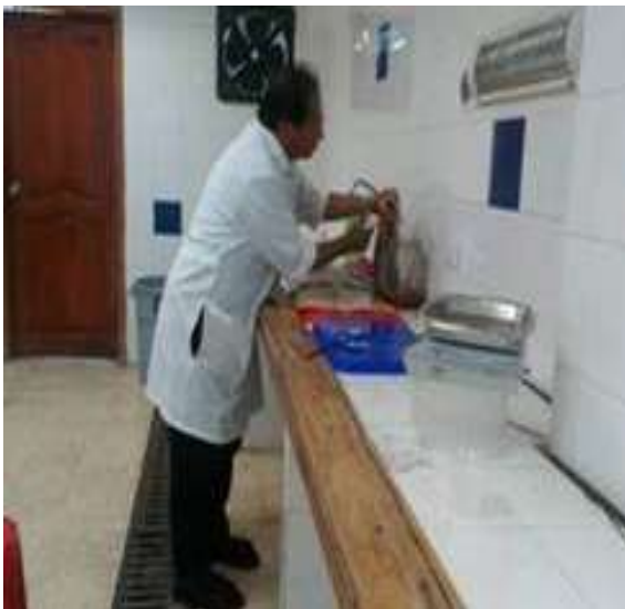
Figura 2. Muestreo en laboratorio de 32 a 44 cm LM para los machos.

El 84.1% de los organismos fueron hembras y 15.9% machos, la longitud de manto (LM) estuvo entre 30 y 48 cm LM para las hembras y