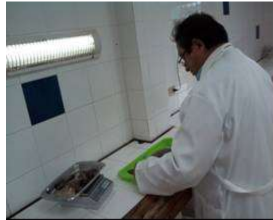
Figura 3. Análisis de madurez gonadal

El estadio de madurez gonadal para hembras y machos fue de 30.8% Inmaduro (estadio I) y 69.2% madurando (estadio II) (Figura 3).