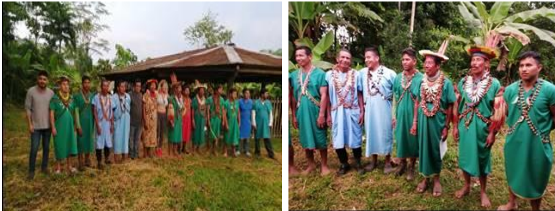
Foto 1. Participación de los líderes de las comunidades de Puerto Bolívar, San Victoriano, Sëoquëya y Tarabëaya