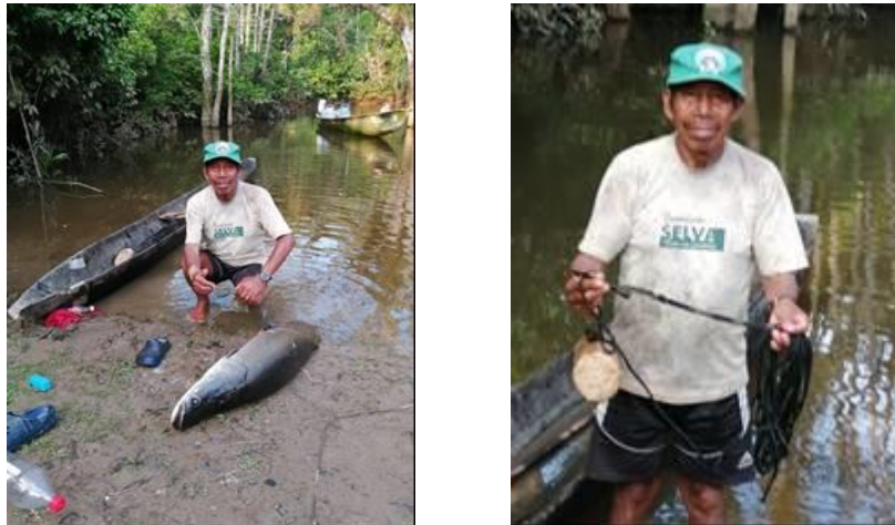
Foto 2. Captura de paiche con artes de pesca tradicionales