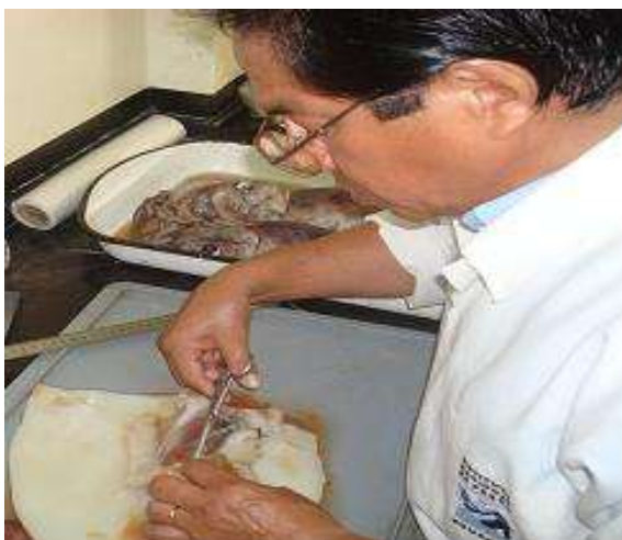
Figura 2. Análisis del calamar gigante

En el laboratorio multipropósito de Salinas y facilidad pesquera de Santa Rosa, se analizaron 277 organismos de calamar gigante (Figura 2) provenientes de la pesca incidental, realizada principalmente con red de enmalle frente al Golfo de Guayaquil.