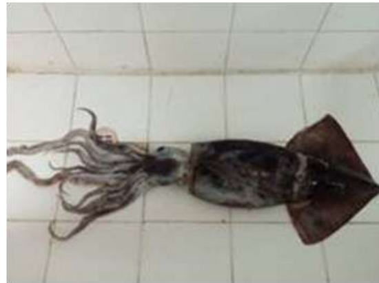
Figura 1. Calamar gigante Dosidicus gigas

El desembarque de calamar gigante en el puerto de Santa Rosa y Anconcito (Figura 1) fluctuó entre 2 y 7 t, disminuyendo un 90% respecto al mes anterior, debido probablemente a la distribución oceánica de las áreas de pesca de mayor concentración y asociada a la presencia de aguas frías de 19.5°C reportadas por Earth (2019).